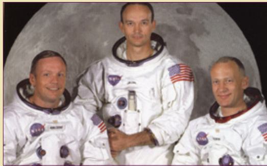
Neil Alden Armstrong, Buzz Aldrin et Michael Collins