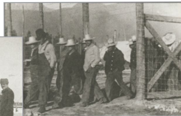
Groupe de travailleurs au camp d'internement de Castle Mountain, en Alberta, en 1915

Éditions Scholastic 604, rue King Ouest Toronto (Ontario) M5V 1E1 www.scholastic.ca/editions