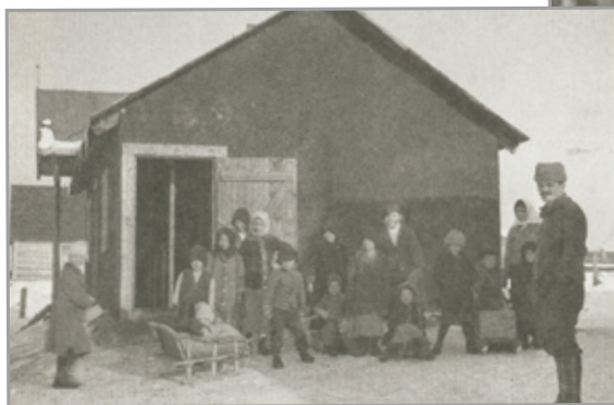
Prisonniers posant devant une des habitations du camp des personnes mariées, au camp d'internement de Spirit Lake