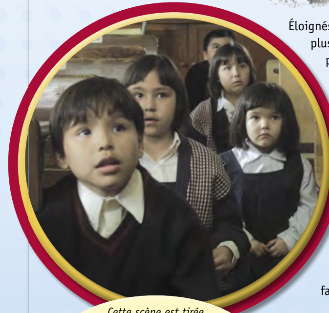
Cette scène est tirée du film Nous n'étions que des enfants , de Tim Wolochatiuk (2012). Le film raconte la difficile histoire de Lyna Hart et de Glen Anaquod, qui ont été envoyés à un très jeune âge dans un pensionnat indien.

Les pensionnats ont aussi séparé les Autochtones de leur culture. En effet, les élèves n'apprenaient rien sur leurs peuples et leurs traditions dans ces écoles. C'est ainsi que des générations d'Autochtones ont perdu leur culture. Heureusement, de nombreuses personnes travaillent très fort aujourd'hui pour faire revivre ce savoir ancestral.