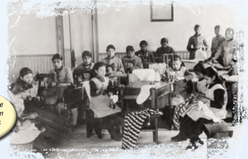
Des filles suivant un cours de couture au pensionnat indien de Fort Resolution, dans les Territoires du Nord-Ouest

Éloignés de leurs enfants, certains adultes ne savaient plus comment être de bons parents. Ils ne savaient pas à quoi ressemblait une famille avant l'ouverture des pensionnats indiens. Quant aux anciens élèves, ils n'ont jamais appris à montrer leur amour à leurs propres enfants, par exemple en les serrant dans leurs bras ou en les embrassant avant de les mettre au lit.