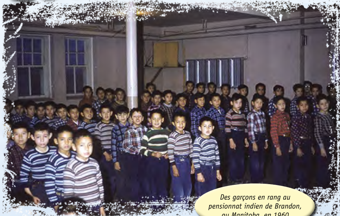
Des garçons en rang au pensionnat indien de Brandon, au Manitoba, en 1960