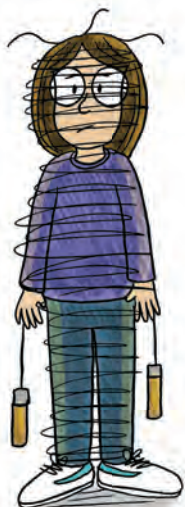
SAUT À LA CORDE

JE SUIS NULLE POUR TOUTES LES ACTIVITÉS PHYSIQUES.