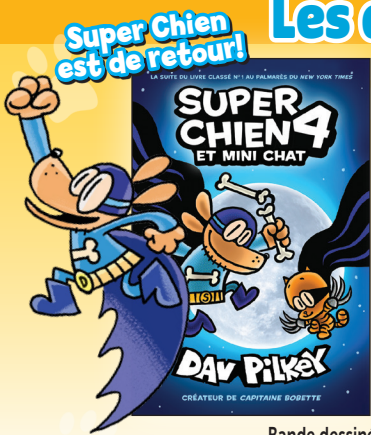
Bande dessinée (Graphic novel) 15 $ chacun