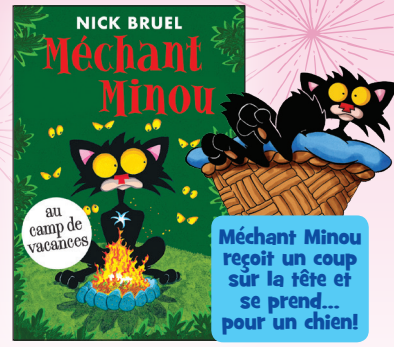
Premier roman (Chapter book) 10 $

Méchant Minou reçoit un coup sur la tête et se prend... pour un chien!