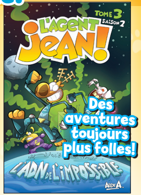
Bande dessinée (Graphic novel) 13,50 $