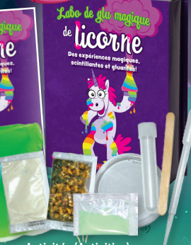
Activités (Activities) Seulement 20 $!