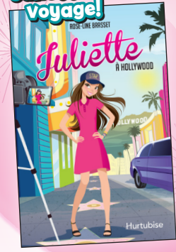
Roman expert (Young adult) 13,50 $ chacun