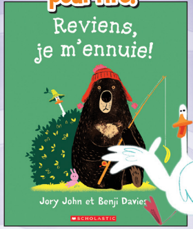
Album illustré (Picture book) 12,50 $