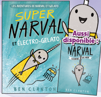
Bande dessinée (Graphic novel) 10,50 $ chacun

Aussi disponible: NARVAL L'ÉCRIVEUSE DE MER