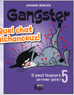
Roman intermédiaire (Intermediate Novel) 11,50 $