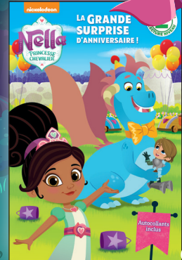
Lecteurs débutants (Early readers) 8 $