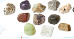
Activités (Activities) 17 $